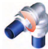
Quitar la tuerca