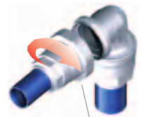
Montar Art. 90620